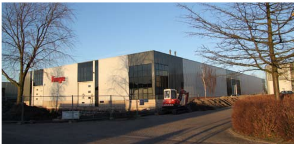
Bever is vanaf begin april gevestigd in het voormalige pand van Hage aan de Ambachtsweg.