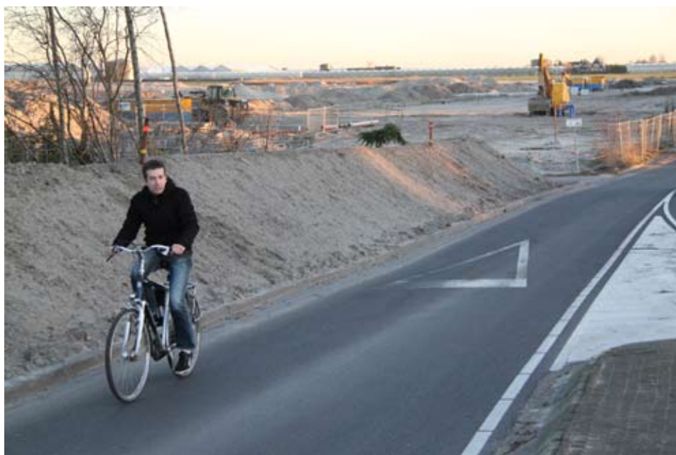
Boezem I en Boezem II moeten straks één mooi geheel gaan vormen met een goede ontsluiting via de nog aan te leggen oostelijke randweg.